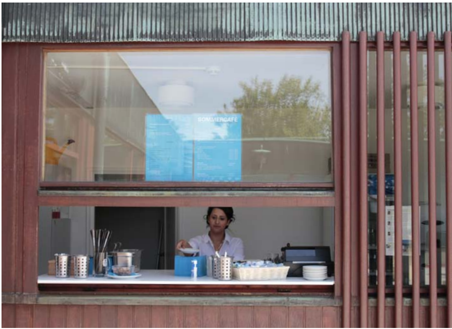
Sommercafe auf der Dachterrasse