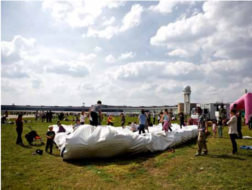
Gue dunt vullaore doloboreet lortincil incilismod dio dit veros nim at ut accum zrrilis iscinis nonsenit

er sed ex ellesseq uipissenit landre vel dolenim zrrilis sequam nostis nisis eum voluptat lum del eu feuismodo endreet ad dio do con verit amconse quatum ad tio do dolorerilit lum volore mod magnibh enis aut prat.