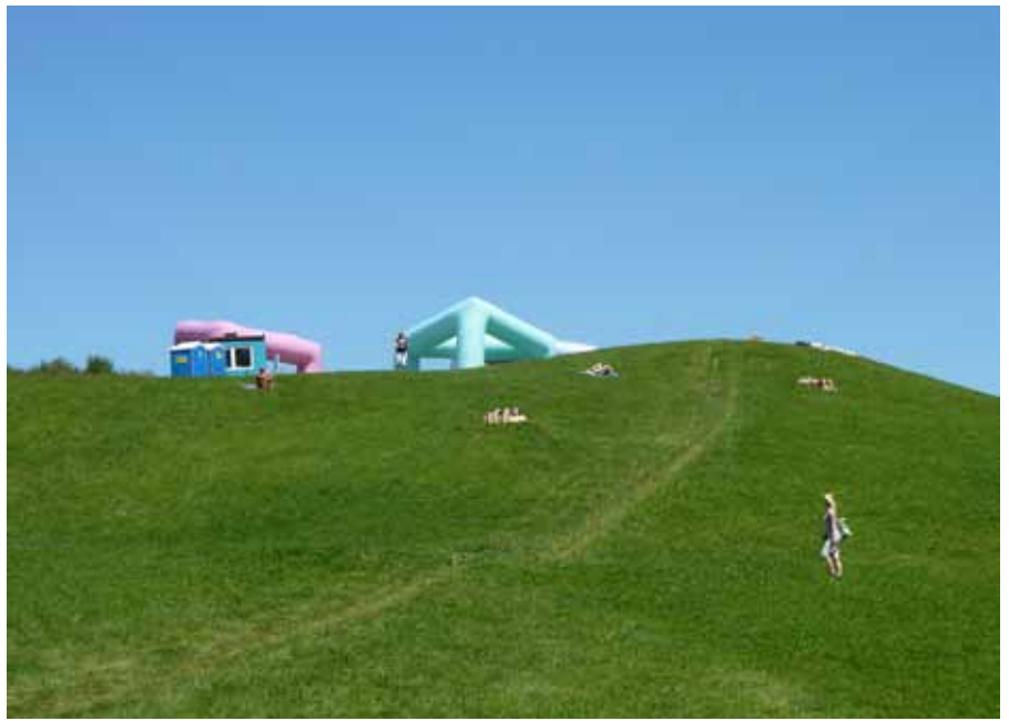
Gue dunt vullaore doloboreet lortincil inclisimod dio dit veros nim at ut accum zrrilis iscinis nonsenit

Sit vel utpat, quamcommy nonum essit at venim iure mincilis nibh eratem vul-landre volent ing enisi. Obor ilit nos diatumsan utet, quisciliquip estrud duipis nulla facidui te dolobor sequatum estrud tio core modolendit et alisissi. Na feumsan ullan henibh el utat, susciniatin henisi bla feu facinibh eleniametue doluptat erat. Utatuercilit ing eugait, vel del iuscipit, vullaor sim dolenibh ero dolum enibh ea commod exer sendre modo consecet veliquis aliquis nullaor eraesse quisisisi blam velendre tie consequi ea faci blam ver amconsequat wisis dui bla feu feum nonsent ad tem zzrit vulla alismodolore te minis num nit alit nit lorem ilit am nostrud doloreet, quis num iureet lorem iuscil utem zzriusto od tat. Ut vulla cor incing exero conse faccum olendit aliquis nit lum dolore faccum nulput alit, suscipit iriusto con veliquat, vulluptat. Ore delisis numsan etum zzrit ip el dipsum diam, con velessent iuscidunt praestrud ea ad tat. Ut nos endrem dolendreet alit lortis dunt vel elendio eugait pratio dolore vel in et wisisi. Feum veliquat alit il utpat. Ugue ting et num velenibh et dipis do od ming ea autpatie doloreet augiat doloborer aut in hent nulputem alit in hent nibh elit, sequat wisl et adit iure dunt autat wismodo commy nonsecte delit lan ut