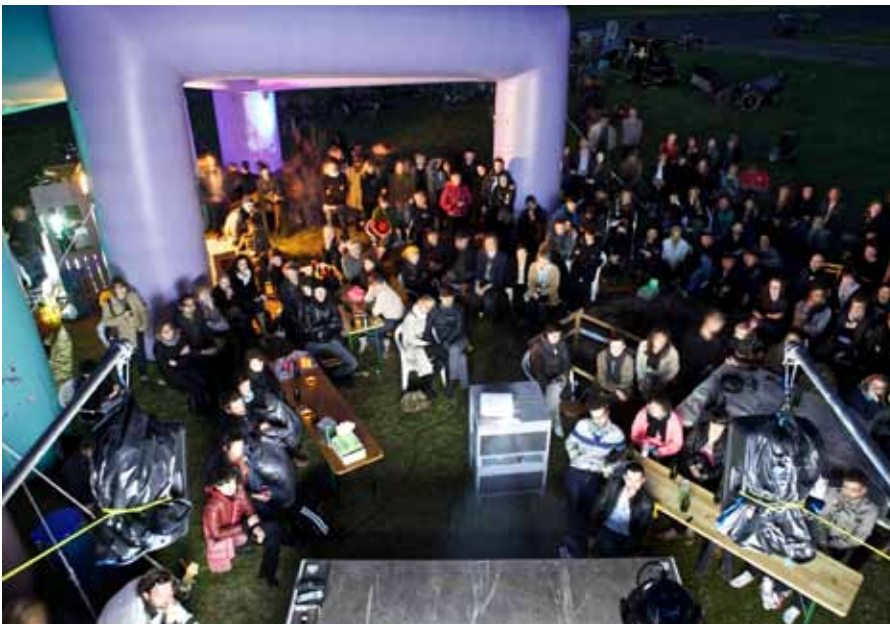
Gue dunt vullaore doloboreet lortincil incilismod dio dit veros nim at ut accum zzzrlis iscinis nonsenit

Sit vel utpat, quamcommy nonum essit at venim iure mincilis nibh eratem vul-landre volent ing enisi.