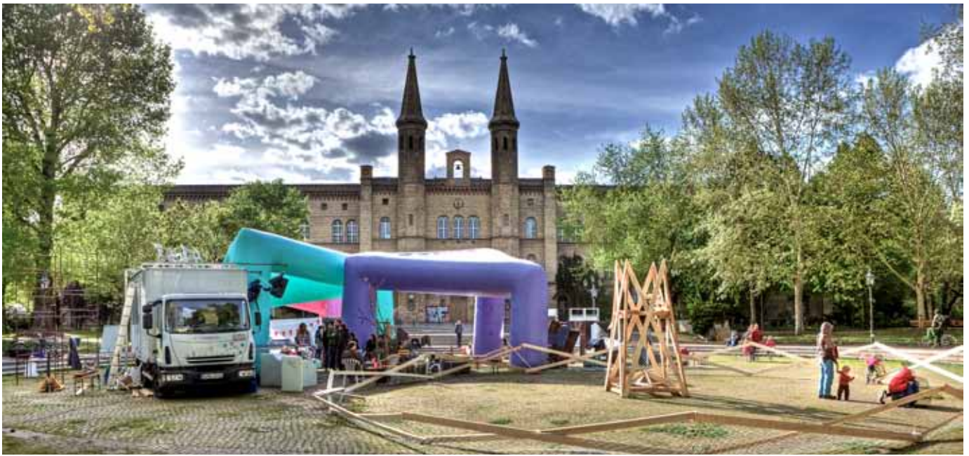
Gue dunt vullaore doloboreet lortincil incilismod dio dit veros nim at ut accum zzrilis iscinis nonsenit