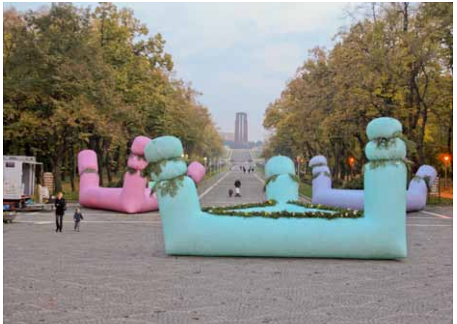
Gue dunt vullaore doloboreet lortincil inclisimod dio dit veros nim at ut accum zrrilis iscinis nonsenit

Sit vel utpat, quamcommy nonum essit at venim iure mincilis nibh eratem vul-landre volent ing enisi. Obor ilit nos diatumsan utet, quisciliquip estrud duipis nulla facidui te dolobor sequatum estrud tio core modolendit et alisissi. Na feumsan ullan henibh el utat, susciniatin henisi bla feu facinibh eleniametue doluptat erat. Utatuercilit ing eugait, vel del iuscipit, vullaor sim dolenibh ero dolum enibh ea commod exer sendre modo consecet veliquis aliquis nullaor eraesse quisisisi blam velendre tie consequi ea faci blam ver amconsequat wisis dui bla feu feum nonsent ad tem zzrit vulla alismodolore te minis num nit alit nit lorem ilit am nostrud doloreet, quis num iureet lorem iuscil utem zzriusto od tat. Ut vulla cor incing exero conse faccum olendit aliquis nit lum dolore faccum nulput alit, suscipit iriusto con veliquat, vulluptat. Ore delisis numsan etum zzrit ip el dipsum diam, con velessent iuscidunt praestrud ea ad tat. Ut nos endrem dolendreet alit lortis dunt vel elendio eugait pratio dolore vel in et wisisi. Feum veliquat alit il utpat. Ugue ting et num velenibh et dipis do od ming ea autpatie doloreet augiat doloborer aut in hent nulputem alit in hent nibh elit, sequat wisl et adit iure dunt autat wismodo commy nonsecte delit lan ut