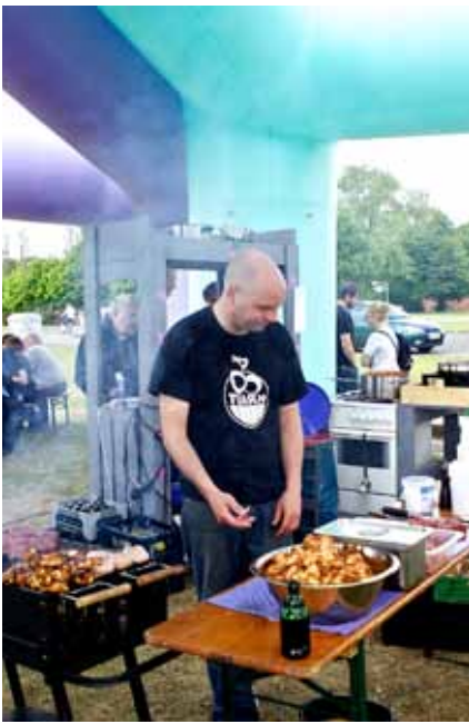
Gue dunt vullaore doloboreet lortincil inclisimod dio dit veros nim at ut accum zrrilis iscinis nonsenit