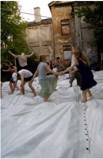
Gue dunt vullaore doloboreet lortincil incilismod dio dit veros nim at ut accum zrrilis iscinis nonsenit