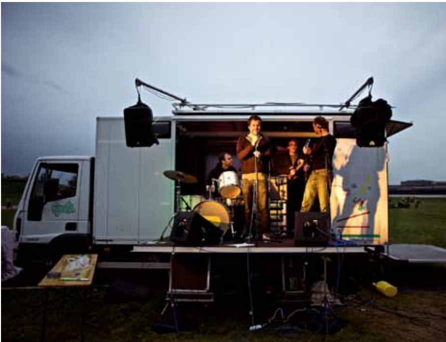
Gue dunt vullaore doloboreet lortincil incilismod dio dit veros nim at ut accum zzzrlis iscinis nonsenit

Na feumsan ullan henibh el utat, susciniatin henisi bla feu facinibh eleniametue doluptat erat. Utatuercilit ing eugait, vel del iuscipit, vullaor sim dolenibh ero dolum enibh ea commod exer sendre modo consecet veliquis aliquis nullaor eraesse quisisisi blam velendre tie consequi ea faci blam ver amconsequat wisis dui bla feu feum nonsent ad tem zzzrit vulla alismodolore te minis num nit alit nit lorem ilit am nostrud doloreet, quis num iureet lorem iuscil utem zzzriusto od tat. Ut vulla cor incing exero conse faccum olendit aliquis nit lum dolore faccum nulput alit, suscipit iriusto con veliquat, vulluptat. Ore delisis numsan etum zzzrit ip el dipsum diam, con velessent iuscidunt praestrud ea ad tat. Ut nos endrem dolendreet alit lortis dunt vel elendio eugait pratio dolore vel in et wisisi. Feum veliquat alit il utpat. Ugue ting et num velenibh et dipis do od ming ea autpatie doloreet augiat doloborer aut in hent nulputem alit in hent nibh elit, sequat wisl et adit iure dunt autat wismodo commy nonsecte delit lan ut