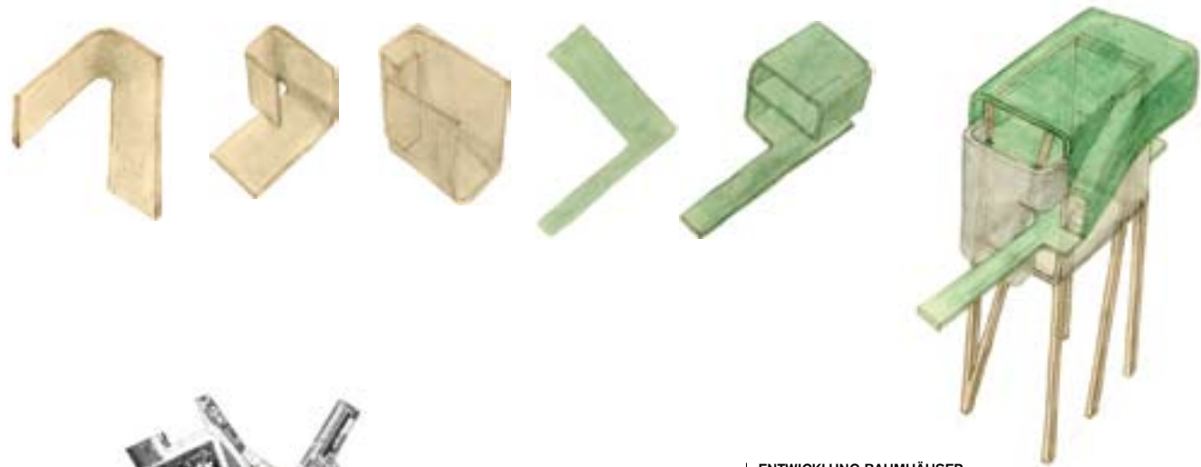
ENTWICKLUNG BAUMHÄUSER establishment of treehouses