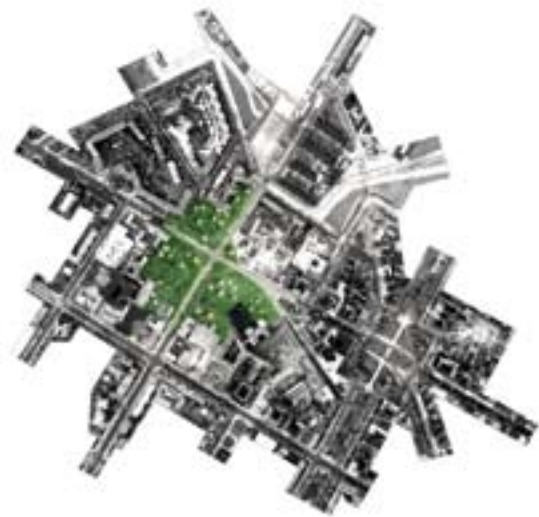
WALDCOLLAGE forest collage