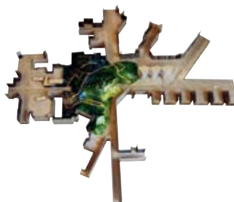
BERGMODELL model of mountain