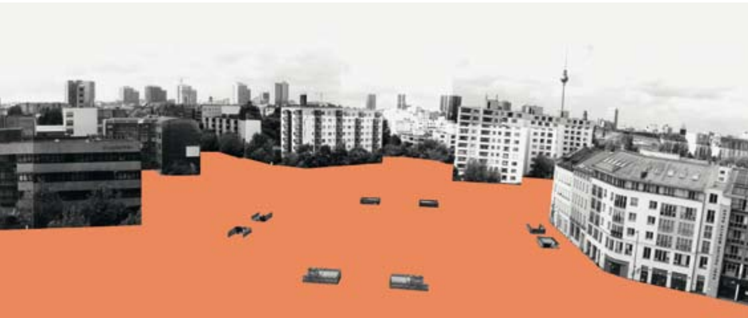
FREIRAUM MORITZPLATZ freedom zone at Moritzplatz