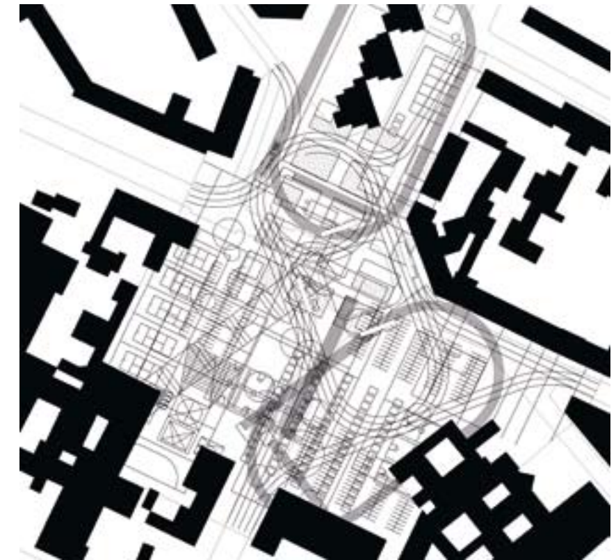
KARTIERUNG SPIELFELD mapping of playground